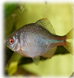
Rhodeus (sericeus) amarus